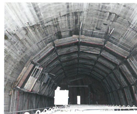
Das Unternehmen ist in der Lage, in großen Dimensionen zu arbeiten; hier ein Rissanierungs-Projekt: AKE (Abwasserkanal Enscher)

Sanierungen von Tunneln oder Kanälen sind komplexe Projekte. Die Arbeit ist schwer, häufig schmutzig und zudem sind Spezialwissen und eine entsprechende Ausrüstung gefragt. Die I+D Sanierungstechnik GmbH, mit Sitz in Bocholt, ist Spezialist für die Sanierung von Kanälen, insbesondere Großprofilen. Mit einem umfassenden Dienstleistungsprogramm, Erfahrung und modernen Technologien sieht Geschäftsführer Frank Angrick zuversichtlich dem neuen Jahr entgegen.