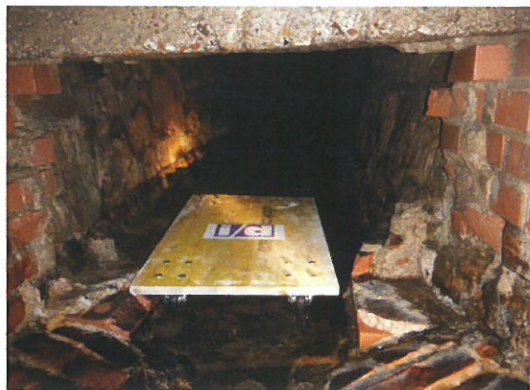
Die Sanierung eines Tunnels der Kunsthalle Bielefeld